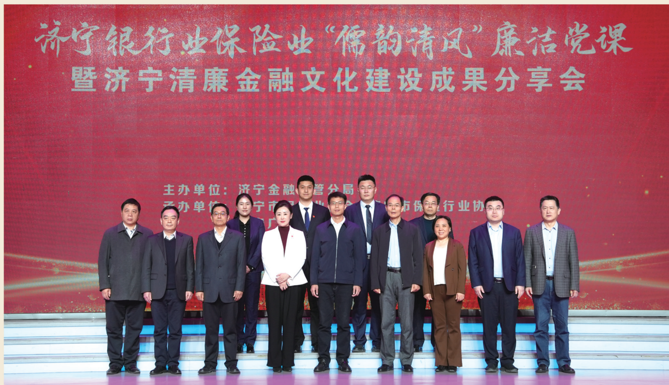
济宁银行业保险业举办“儒韵清风”廉洁党课暨清廉金融文化建设成果分享会